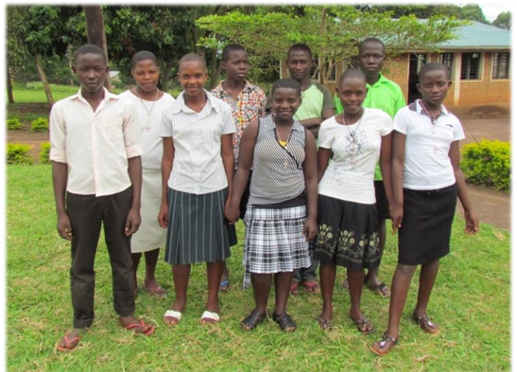
Diese neun Kinder haben dieses Jahr nach sieben Schuljahren ihren Grundschulabschluss gemacht. Sie wechseln nun auf die weiterführende Schule (ein Internat) und werden dort über unser Patenschaftsprogramm unterstützt. Acht weitere Jugendliche haben ihr O-Level (also die mittlere Reife) geschafft - ein Meilenstein für sie auf dem Weg zu einer Berufsausbildung und einem guten Arbeitsplatz.